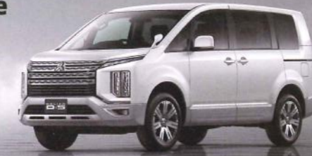
PHOTO: DELICA D:5 G-Power Package ボディカラー:ウォームホワイトパール/スターリングシルバーメタリック(有料色)